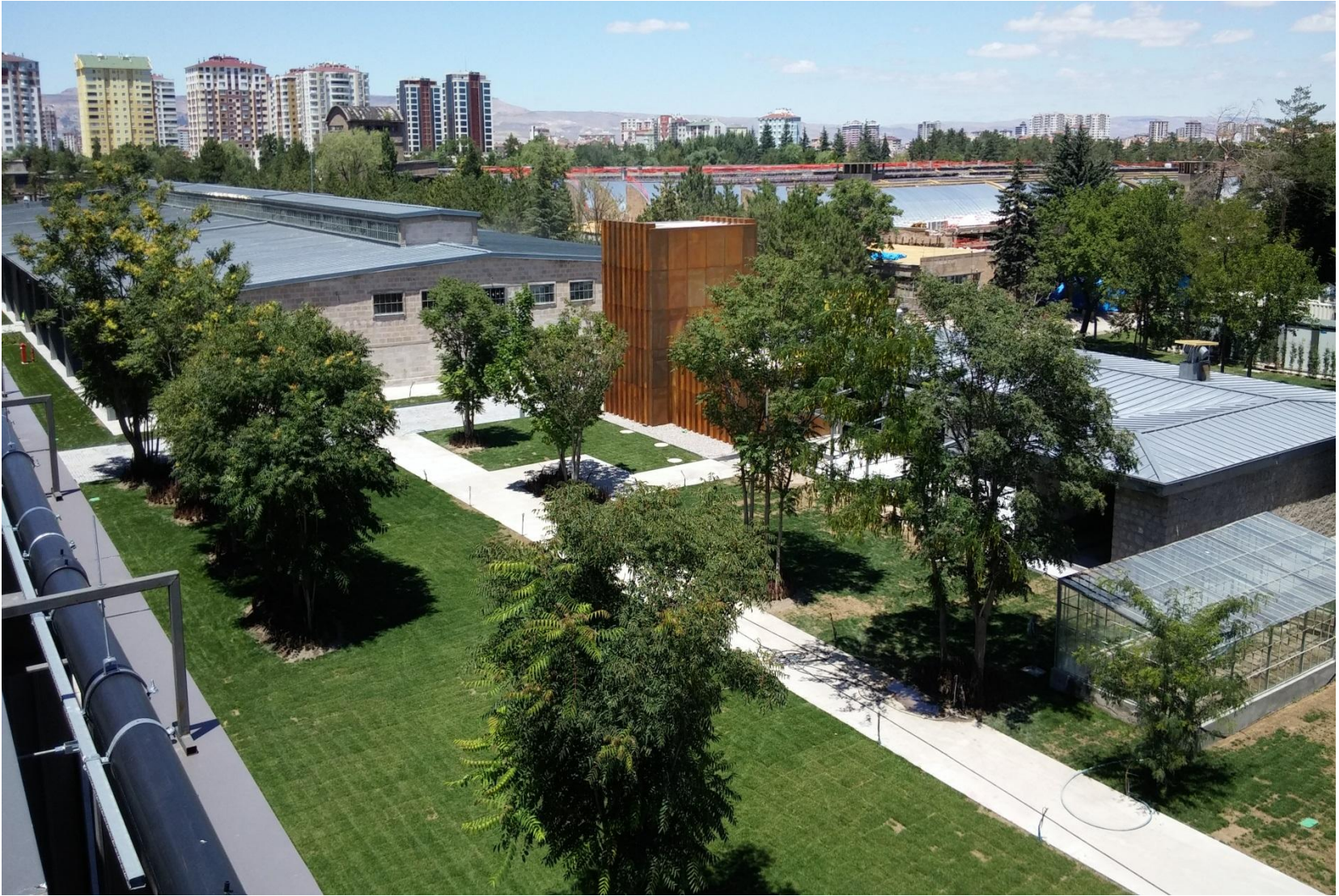
Mamul Ambarı ve İtfaiye Binası İnşaatı Şimdiki Hali