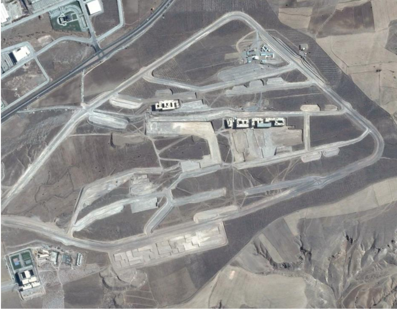
Mimar Sinan Kampüsü 2016 Yılından Uydu Görüntüsü