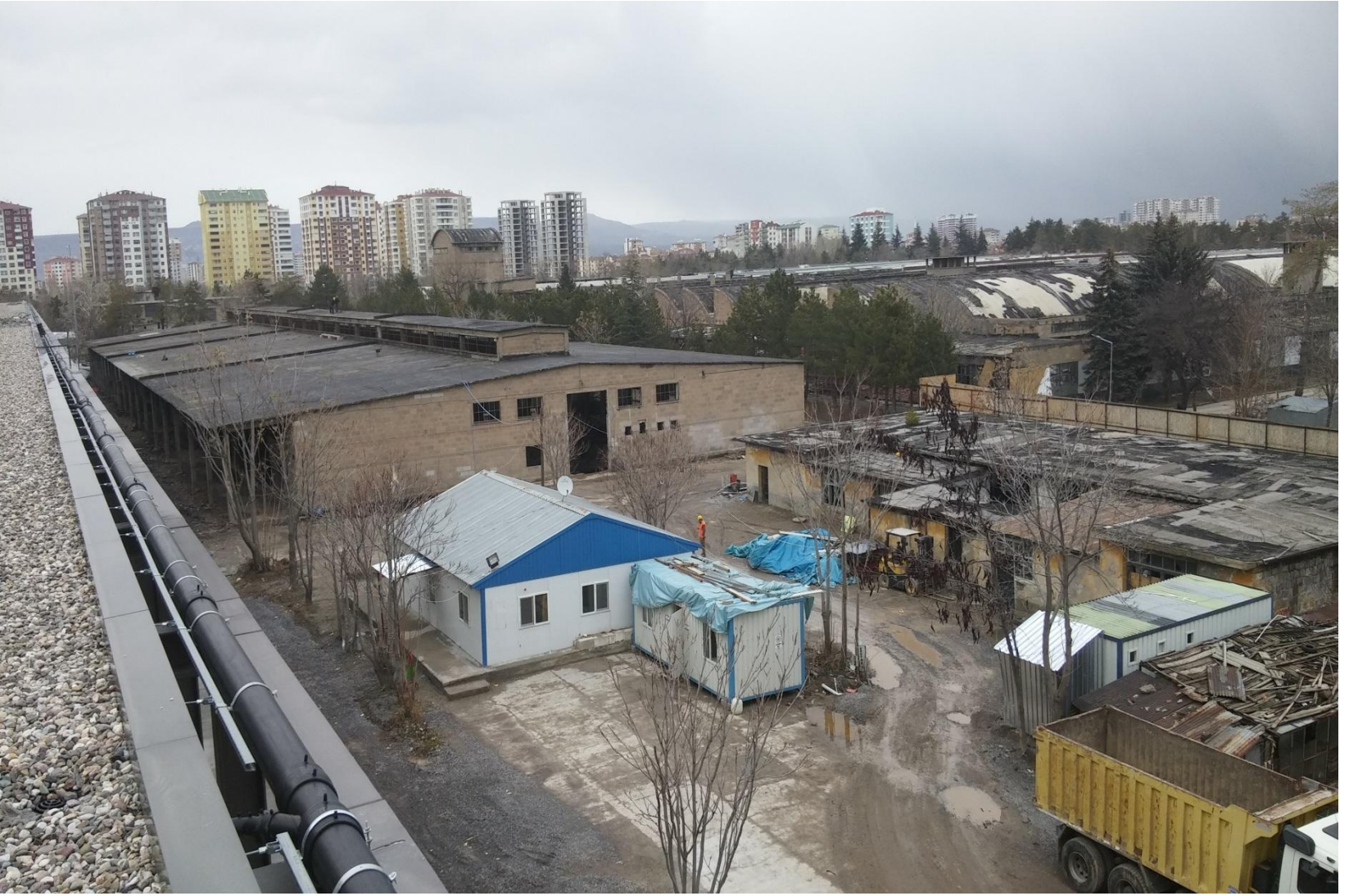
Mamul Ambarı ve İtfaiye Binası Eski Hali