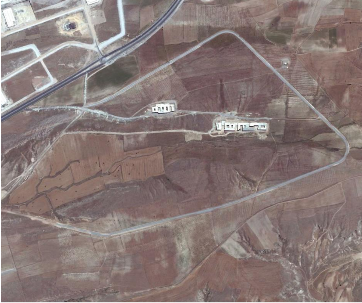
Mimar Sinan Kampüsü 2014 Yılından Uydu Görüntüsü